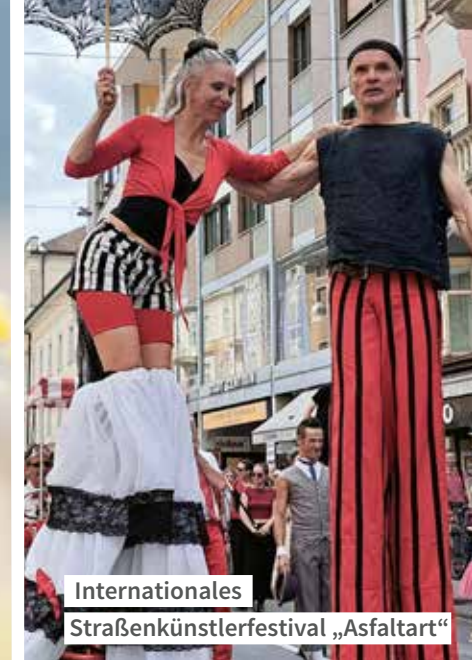
Internationales Straßenkünstlerfestival „Asfaltart“