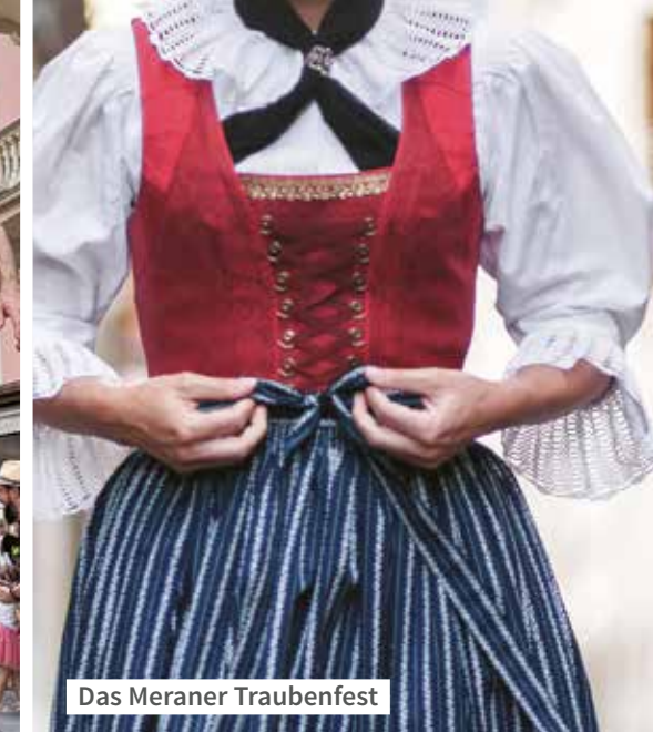
Das Meraner Traubenfest