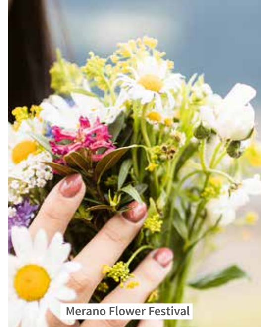
Merano Flower Festival

09:30 Uhr Der Alpenwall – Bunkerbesichtigung Töll mit Führung Ganzjährig Mo-Fr Kellerbesichtigung mit Verkostung der Kellerei Meran in Marling und in der City-Vinothek in Meran Di-So Reiterlebnis beim Tholer